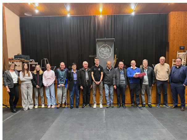
Remise des mérites sportifs, culturels et sociaux